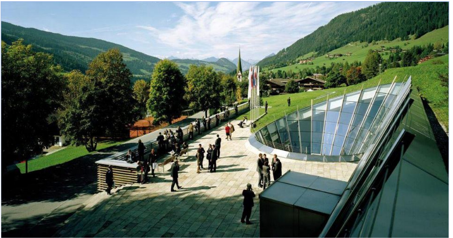
Selo Alpbach u austrijskoj pokrajini Tirol - konferencijski kompleks je najvećim dijelom ukopan u brdo