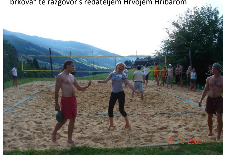
Sportske aktivnosti: planinarenje, odbojka, nogomet, tenis...