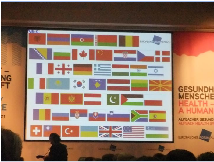
„International Evening“ - nakon Austrije, Hrvatska je 2011. s 36 sudionika imala najveći broj predstavnika u odnosu na ostale države