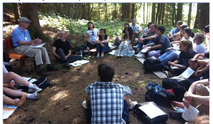
Seminari se povremeno održavaju i u prirodi