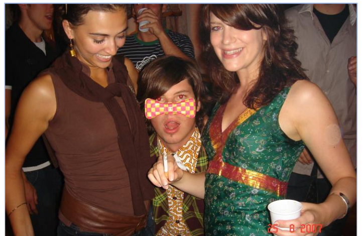
Ozbiljni domjenci, ali i opušteni provodi