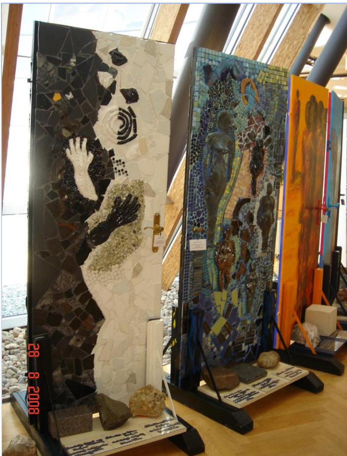
Tijekom EFA-e održava se bogat glazbeni i kulturni program