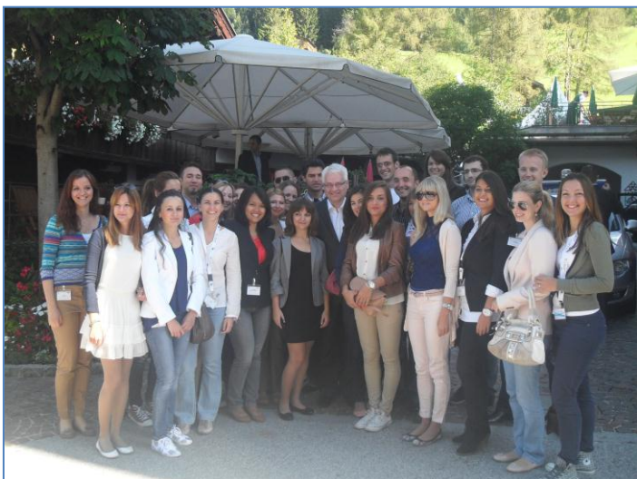
EFA 2012: dio hrvatskih stipendista zajedno s predsjednikom Republike Hrvatske prof. dr. sc. Ivom Josipovićem.