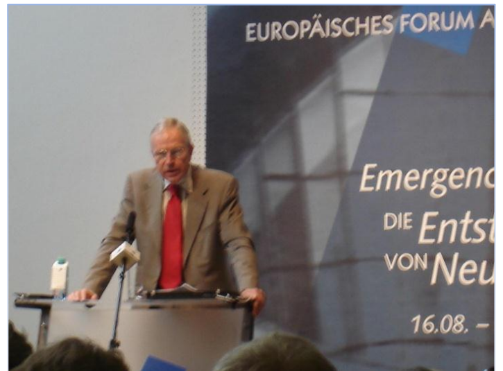
Izlaganje James M. Buchanana, dobitnika Nobelove nagrade za političku ekonomiju