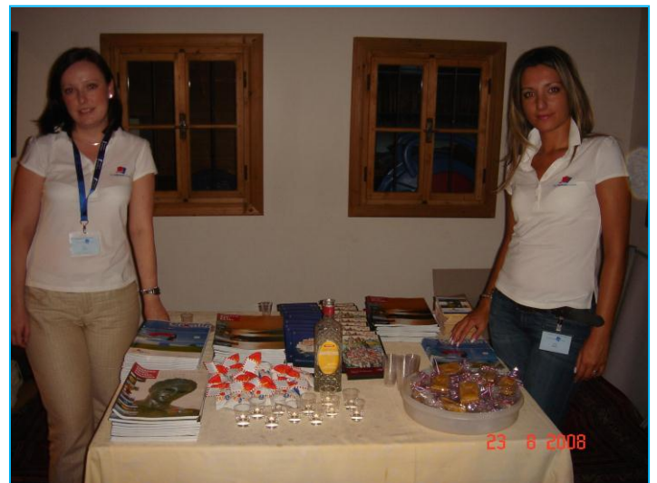
„Film-Workshop“ - predstavljanje Hrvatske uz domaće poslastice kao uvod u večer uz film „Što je muškarac bez brkova“ te razgovor s redateljem Hrvojem Hribarom